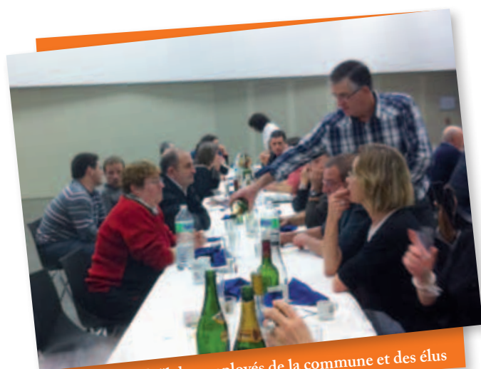
Repas de Noël des employés de la commune et des élus

Inauguration de la Mairie, inauguration de la Véloodyssée, petit à petit Léon dessine son visage de demain et laisse une grande place à tous les moments traditionnels qui sont autant d'occasions de se rencontrer et d'échanger.