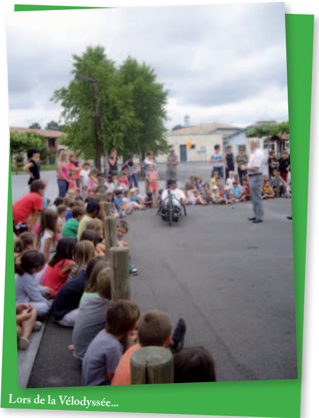
Lors de la Vélodyssée...