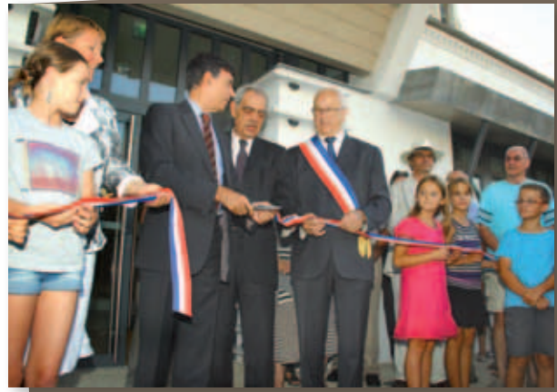
Inauguration de la Mairie en présence de la députée, du préfet, du président du Conseil général