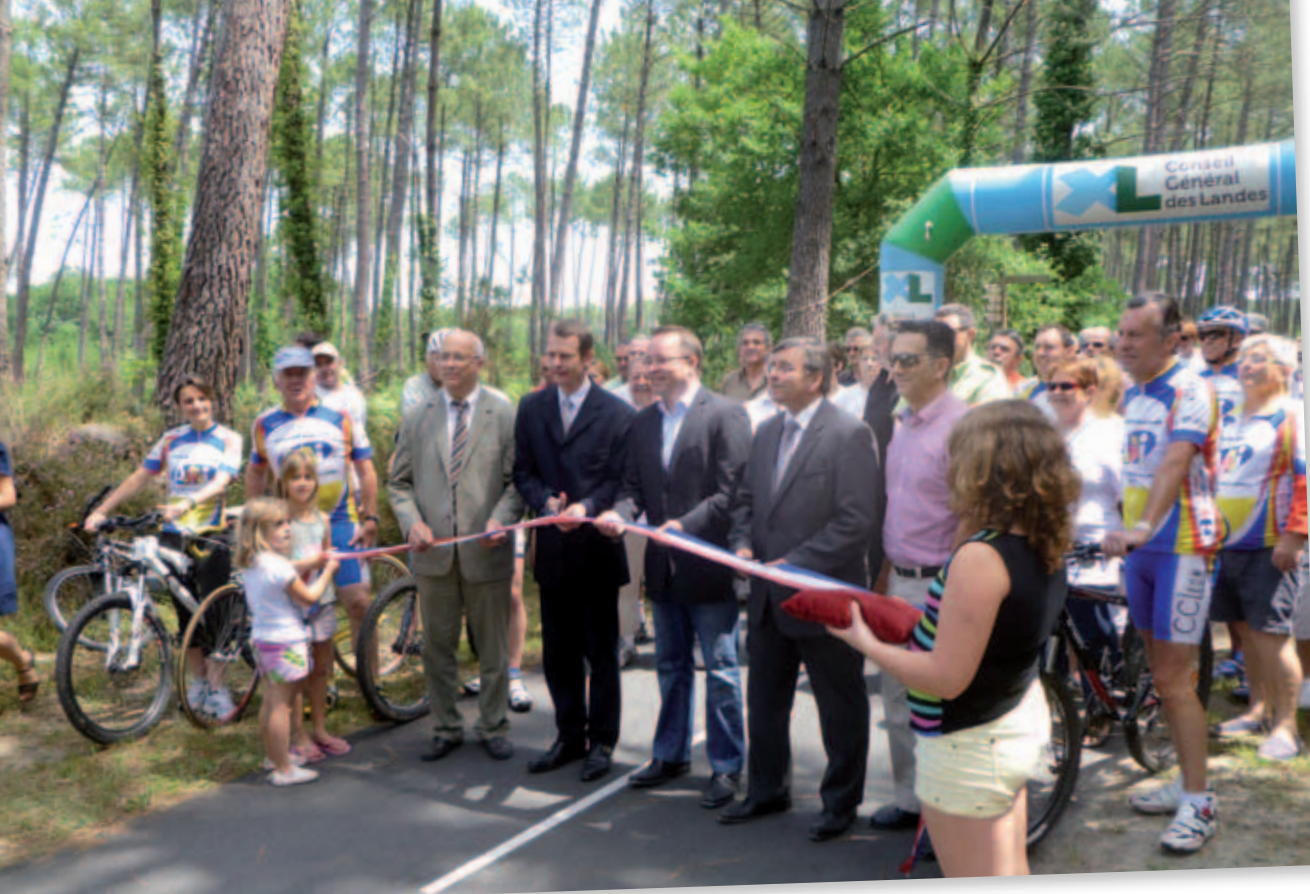
Top départ de la Véloodyssée, la piste cyclable allant de Hendaye à Roscoff en passant par Léon