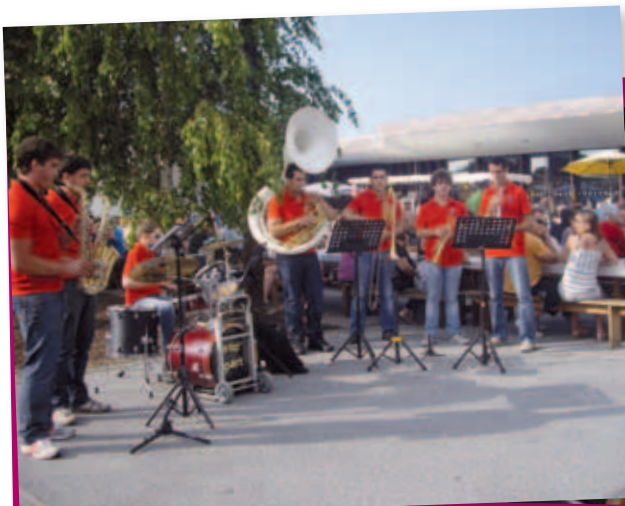
Valoriser les savoir-faire locaux : marché de producteurs du 4 juillet 2012