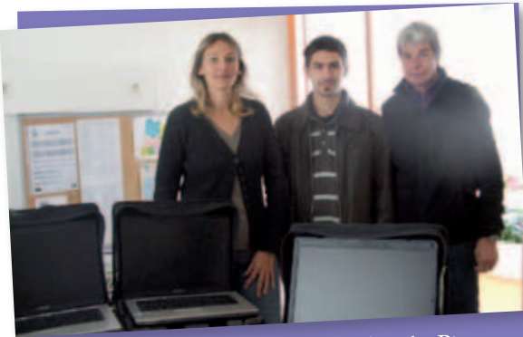
Remise des ordinateurs au groupe scolaire les Pignons