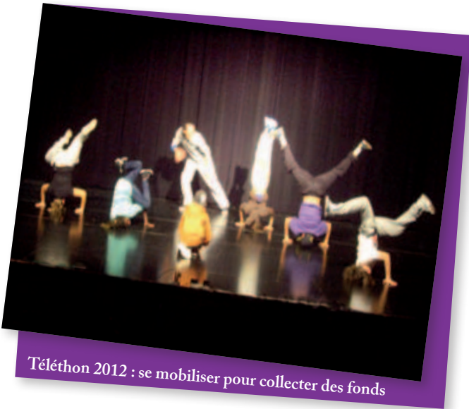
Téléthon 2012 : se mobiliser pour collecter des fonds