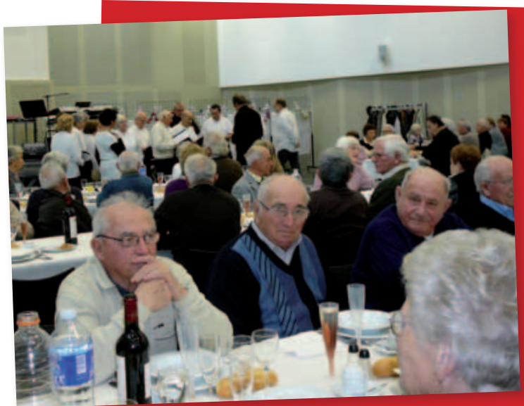
Repas de fin d'année pour les personnes de plus de 70 ans