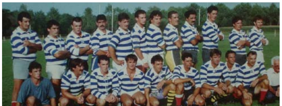
Quand les bateliers faisaient équipe