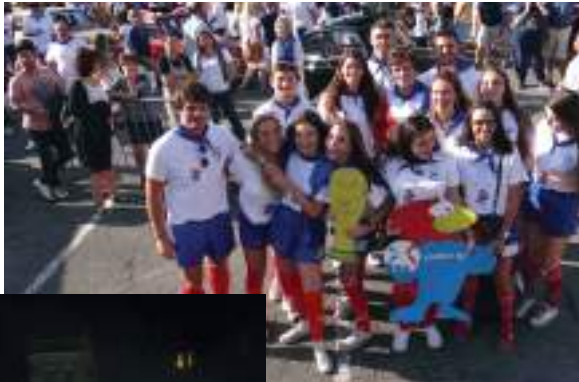
La classe des 20 ans