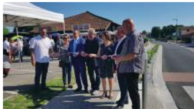
Inauguration de l'Avenue du Marensin