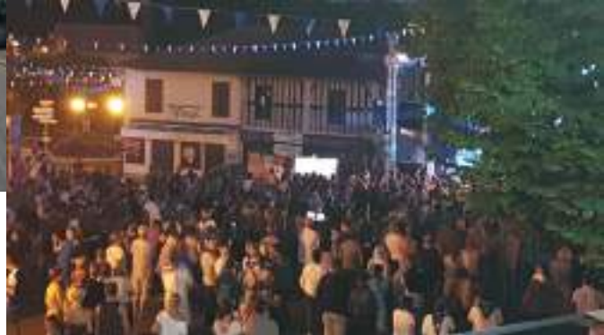
Concert de Sangria Gratuite