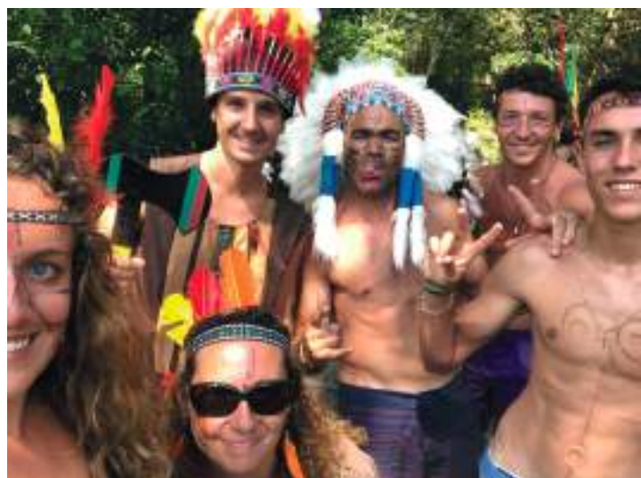
Des animateurs très impliqués