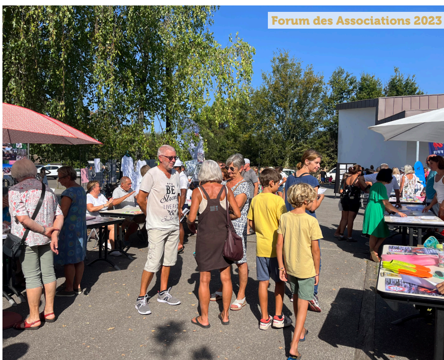
Concert du 14 Juillet