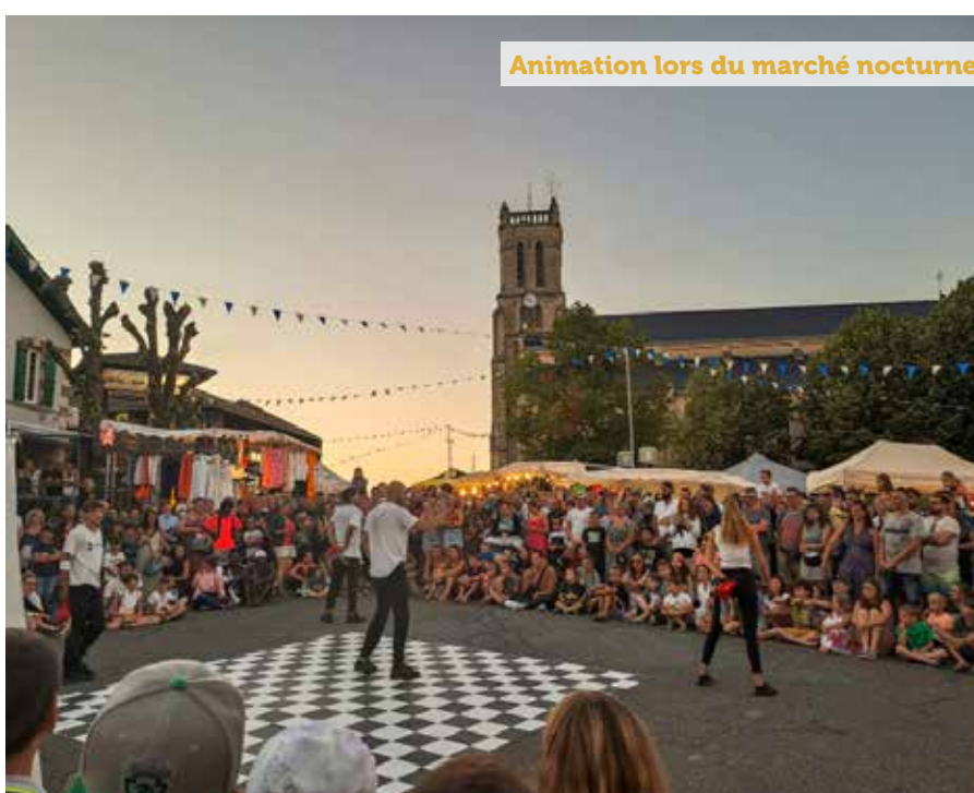
Animation lors du marché nocturne