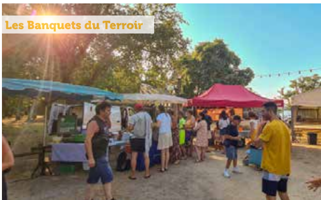
Les Banquets du Terroir