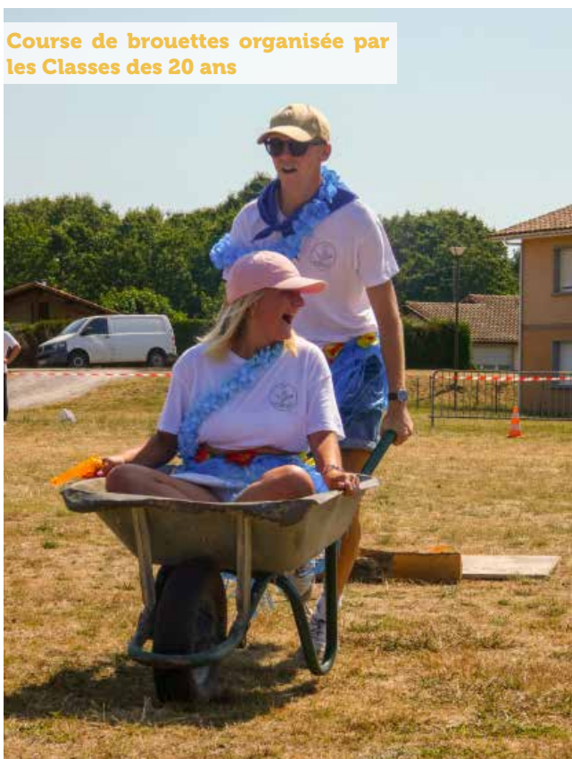
Course de brouettes organisée par les Classes des 20 ans