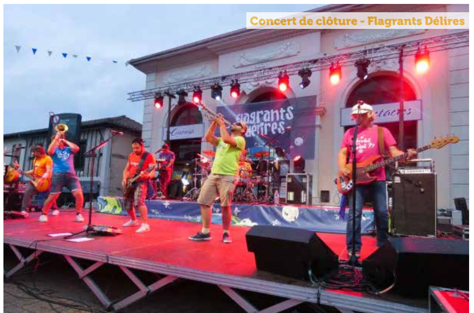
Concert de clôture - Flagrants Délires