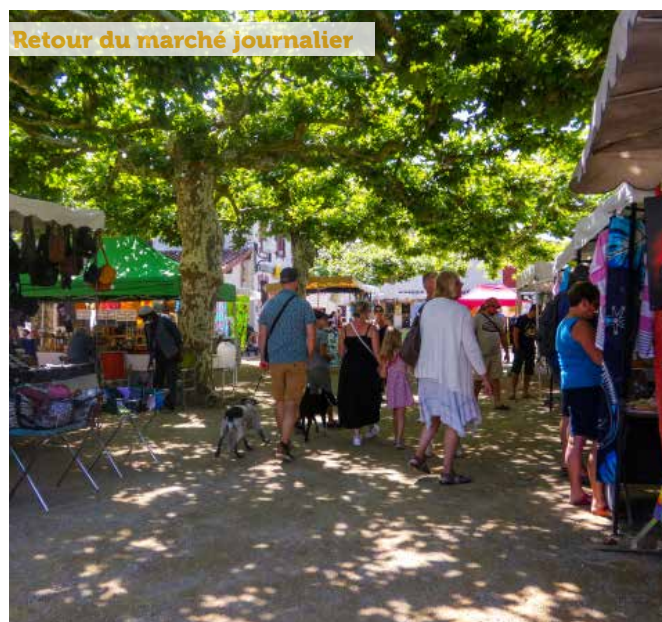
Retour du marché journalier