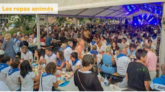
Les repas animés