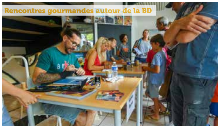
Rencontres gourmandes autour de la BD