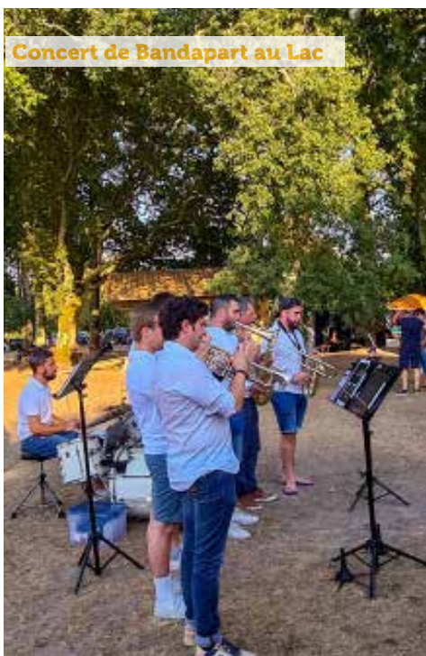
Concert de Bandapart au Lac