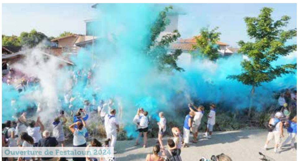
Ouverture de Festaloun 2024