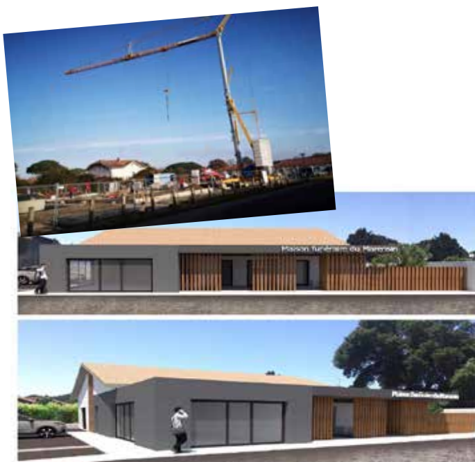
Conception Atelier Charlotte VIGNACQ

Pour prendre rendez-vous, vous pouvez nous contacter au 05 58 49 20 00 ou à mairie@leon.fr